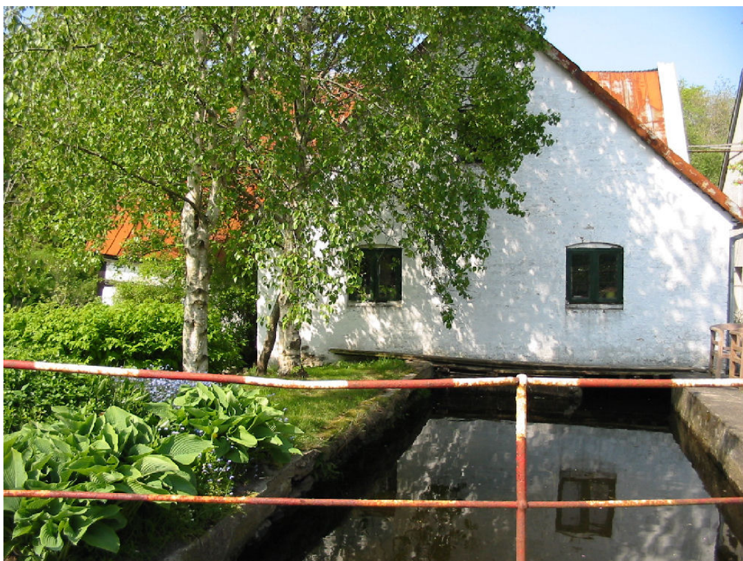
Indløbskanalen hvor vandet fra Binderup Å ledes ind til møllens indvendige vandturbine

Den endelige formidling af restaureringsarbejdet vil blive beskrevet på plancher inde i møllebygningen, ligesom der påtænkes udarbejdet tag-med-foldere i stil med tag-med-folderne omkring Kultur- og Naturstien.