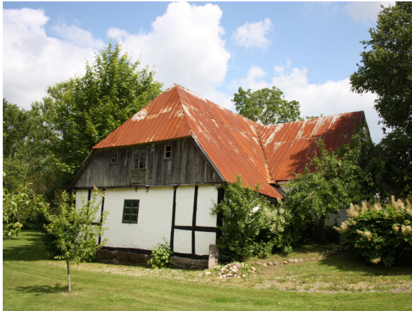
Foto af den gamle vandmølle med en gavl, som nok ikke er hel original.